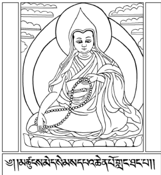
Langri Tangpa Dorje Sengge