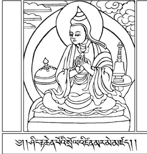
Thánh Atisha (980-1052)

Tâm bồ đề là tâm nguyện vì lợi ích chúng sinh mà cầu giác ngộ. Tâm này quả thật kỳ diệu tuyệt vời. Một trong những vị sư phụ của Lama Atisha có lần nói với ngài như sau: “dù biết được quá khứ vị lai, thấy được linh ảnh đáng Bôn tôn, hay nhập định vững như trái núi, tất cả so với tâm bồ đề đều chẳng có gì đáng nói.” Chúng ta, ngược lại, phục lẫn những thành tựu nói trên. Hoặc chính bản thân, hoặc nghe ai khác làm được những việc như vậy - thấy được linh ảnh của Phật, thấy được chuyện quá khứ vị lai, định vững như trái núi - chúng ta sẽ thấy thật là việc hy hữu tuyệt vời. Thế nhưng sư